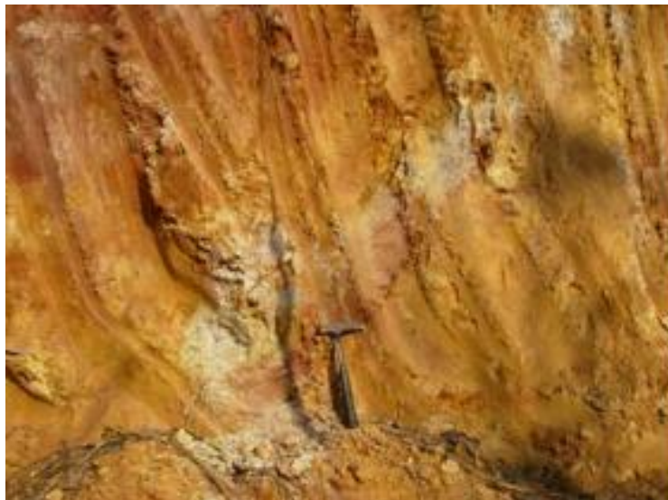
แรดินขาวที่เกิดจากการผุพัง แปรสภาพของหินไรโอลิติกทัฟไฟสีเทาขาว

การกำเนิด ของแรดินขาวแห่งนี้ได้มาจากการแปรสภาพของแร่เฟลตสปาร์ที่เป็นส่วนประกอบอยู่ในเนื้อหิน ภูเขาไฟ ชนิดหินไรโอลิติก ทัฟไฟและหินไรโอไลต์ที่ถูกกระบวนการสลายละลายน้ำร้อน ความร้อนภายในโลก (hydrothermal alteration) ซึ่งเป็นผลมาจากมวลหินอัคนีชนิดหินแกรนิตแทรกซอนขึ้นมาภายหลังส่วนบริเวณที่อยู่ ทางออกไปจากมวลหินแกรนิตจะพบว่าการแปรสภาพเป็นดินขาวน้อยมาก ส่วนใหญ่เกิดจากการผุพังตามธรรมชาติ