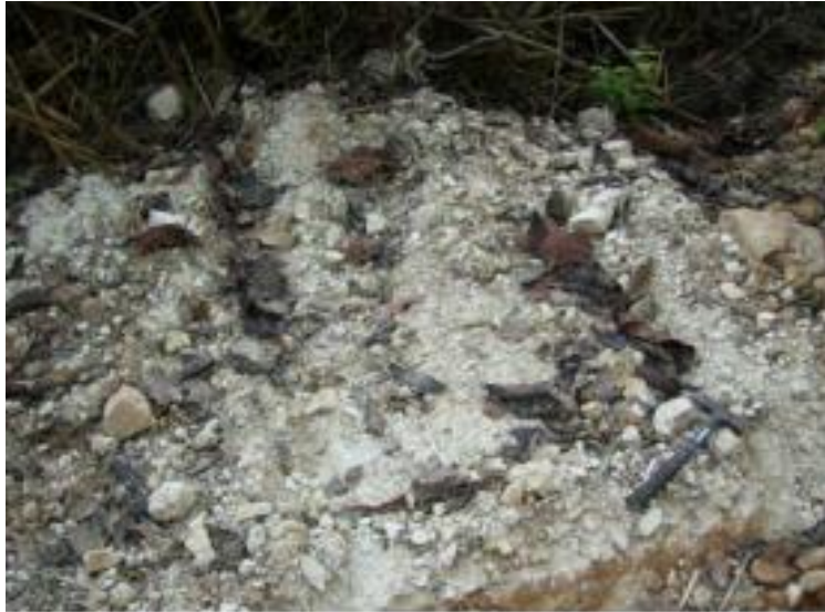
บริเวณแหล่งดินขาว บานนาเมืองทอง อำเภอนายูง