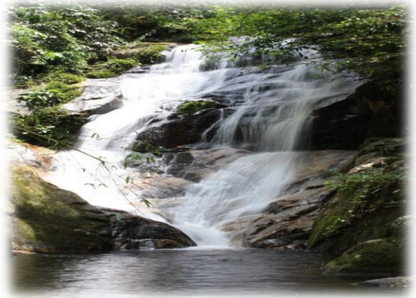
น้ำตกเขาเต่า