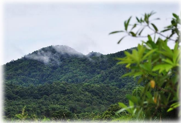
ภูหมอก บ้านปากเจียง ม.๖