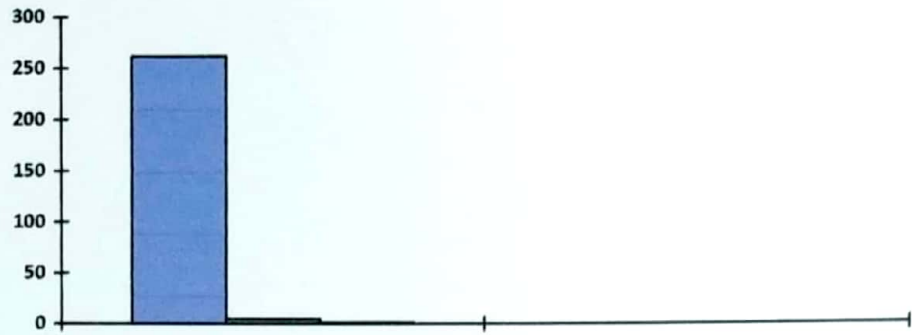
ตาราง ๓ แสดงร้อยละของจำนวนงบประมาณจำแนกตามวิธีการจัดซื้อจัดจ้าง