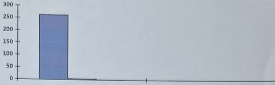
กราฟแสดงจำนวนงบประมาณในการจัดซื้อจัดจ้าง ในปีงบประมาณ พ.ศ. ๒๕๖๖